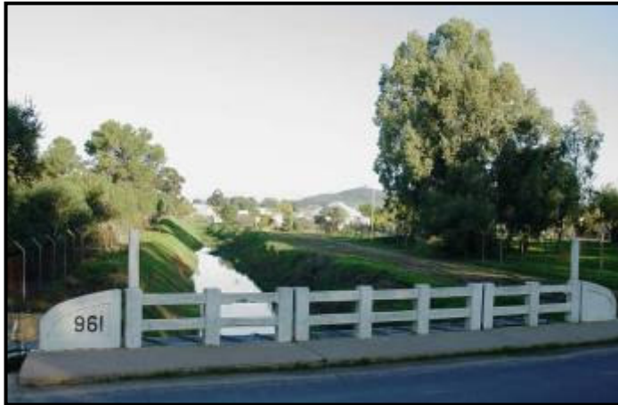
Die Walters-brug in Moorreesburg, ingewy in 1961

as burgemeester, 16 jaar verteenwoordiger op die Skoolraad van Malmesbury, 22 jaar sekretaris van die skoolkomitee, tydelike koster en later skriba van die kerk en jare lank ouderling 34 .