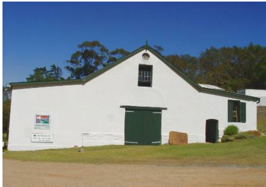
Die huidige kelder op Altydgedacht bestaan uit ’n groot deel van die oorspronklike kelder wat deur Hendrik Munkerus laat bou is. Let op die ou klipfondasies.

Uit Hendricus se boedelinventaris van 1705 is dit duidelik dat daar alreeds met wingerd op groot skaal op De Tijgerbergen geboer was 31 . Volgens die opgaafrolle van 1709 was daar alreeds 30 000 wingerd stokke op die plaas 32 . Die skrywer vermoed dat Hendricus ’n groot deel van die huidige wynkelder in 1702 opgerig het met behulp van die “ metseelaar ” Hoffman. Op 6 September 1707 stel Elsie van Suurwaarden die soldaat Willem Kreijne van Houten as boukneg aan teen 13 Gulden per maand 33 . In hierdie kontrak word na haar verwys as die weduwee Munkerus. Hendricus se sterftedatum kon nog nie met sekerheid vasgestel word nie, maar sy boedel inventaris impliseer dat hy in 1705 oorlede is.