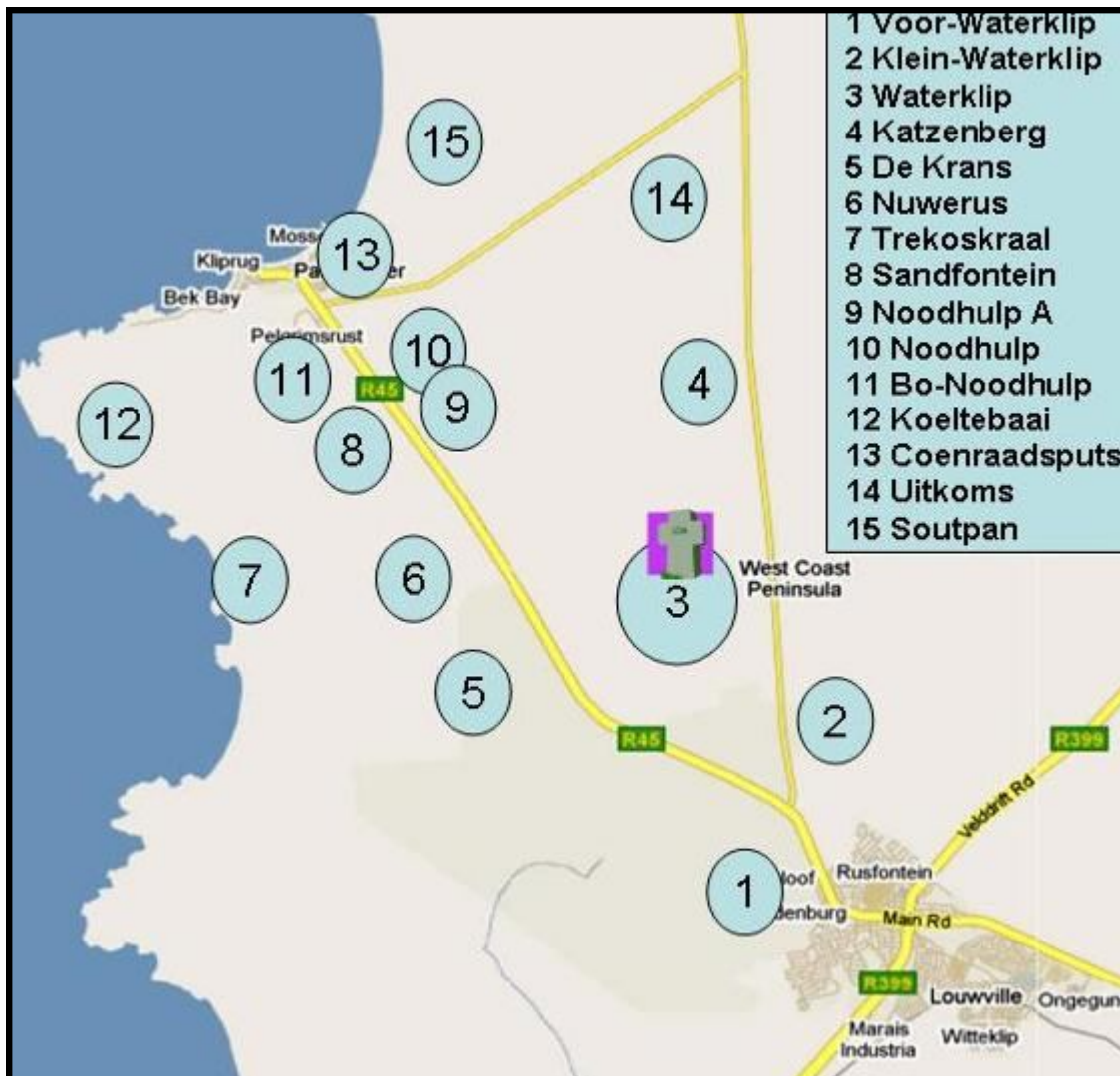
Walters - plase in die Agterbaai.

Ongeveer 4 km verder op die teerpad lê PATERNOSTER voor jou. Op regterhand is daar 'n plaaswerf wat vandag bekend staan as PELGRIMSRUS, maar wat vroeër bekend was as