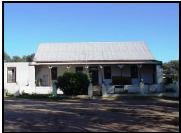
Opstal op Noodhulp waar die skrywer groot geword het.