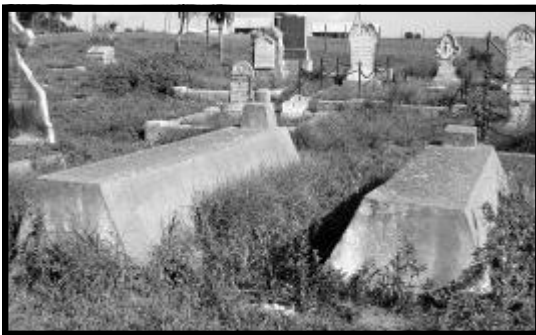
Matthys en Bettie se grafte op Waterklip.

Aan die oostekant, naby die omheining is drie grafte sonder name. (Eers was daar 'n ge-