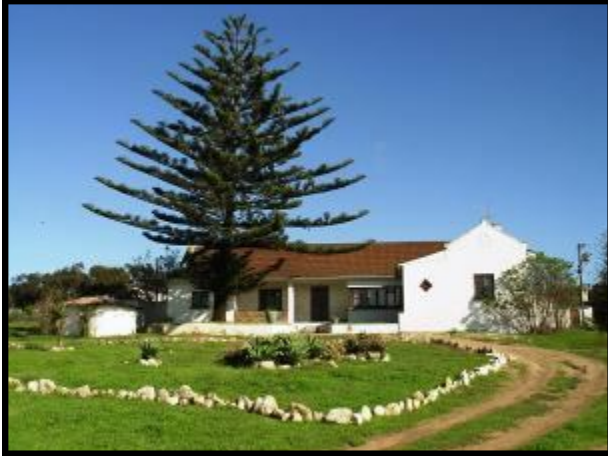
Opstal op Noodhulp A.

en 'n winkelhaak van voor in die linkeroor.